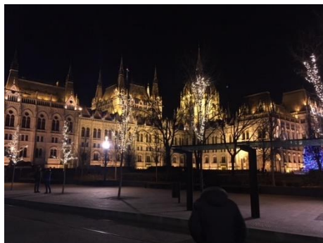
Auf dem Weg von der Arbeit nach Hause: das ungarische Parlament

Bitte fügen Sie hier mindestens ein FOTO von Ihrem Praktikumsaufenthalt ein! Bevorzugte Motive sind Fotos der Unterkunft, des Arbeitsplatzes und bei der Arbeit. Achtung: Aus rechtlichen Gründen senden Sie uns bitte nur selbst erstellte Fotos zu!