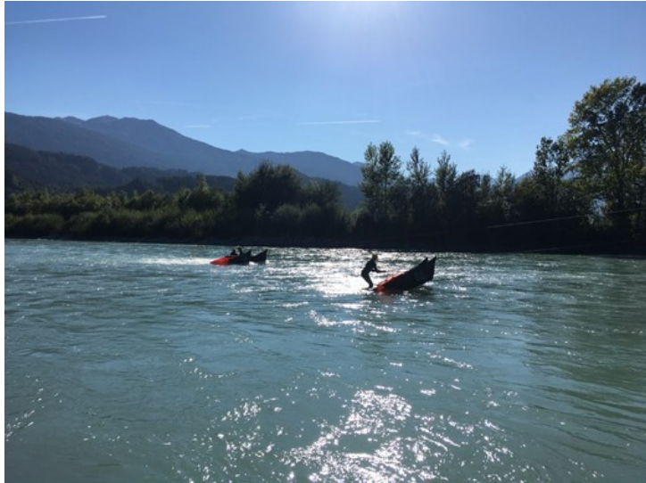
Messungen und Versuche am Inn.